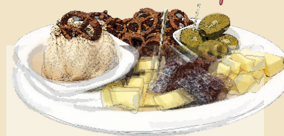
„Rhein Hessische Munkelplatte“